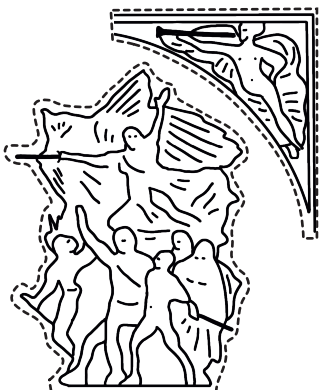
DÉCORS À DÉCOUPER